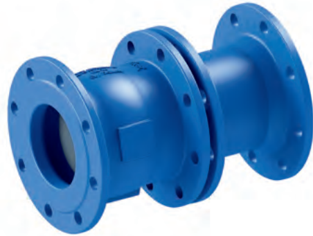
Beispiel: DRV mit Ausgleichsstück (Flanschverbindung bauseits)

PN 25 und PN 40 auf Anfrage alternativ: Ausgleichsstücke auch vormontiert